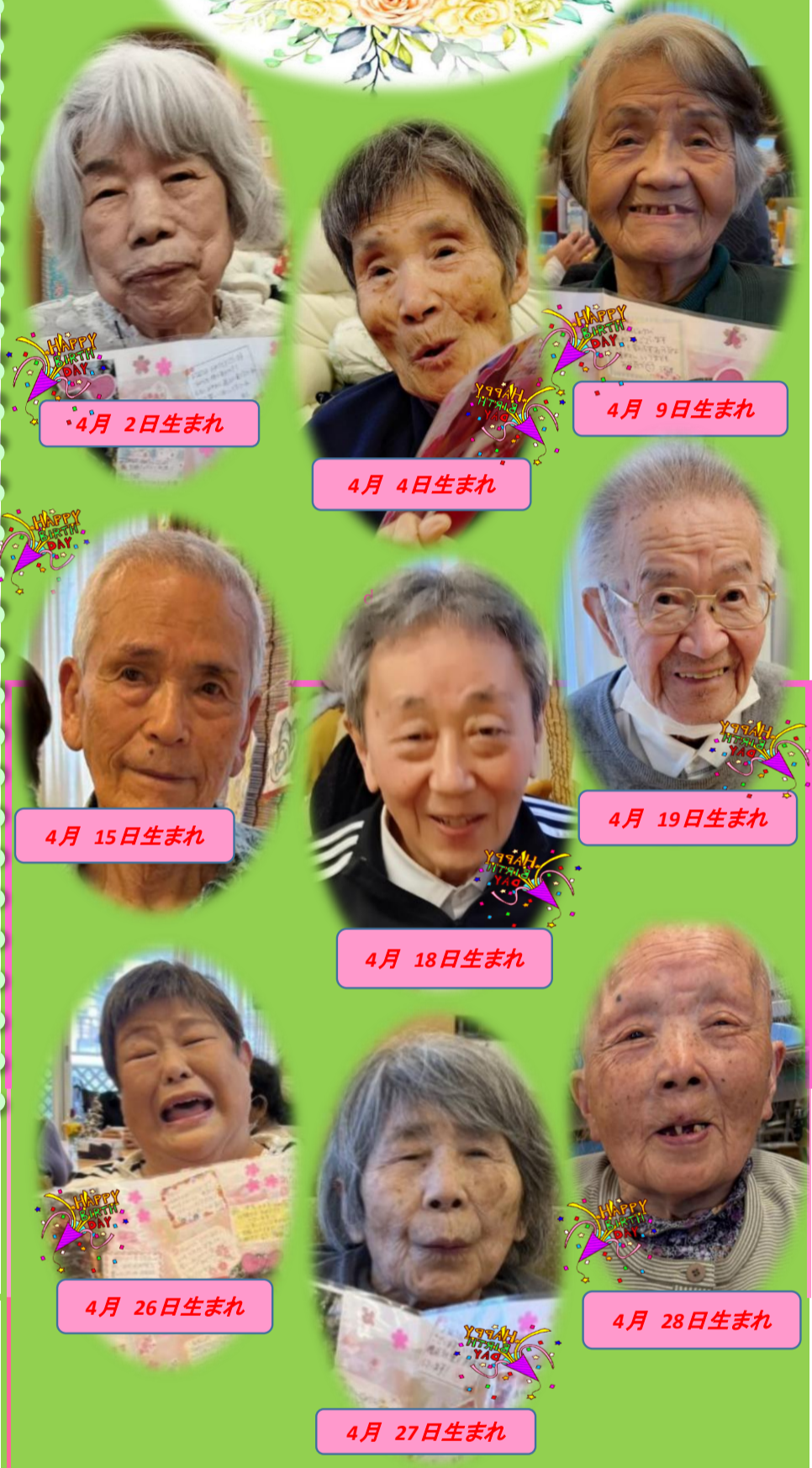
4月 2日 生まれ