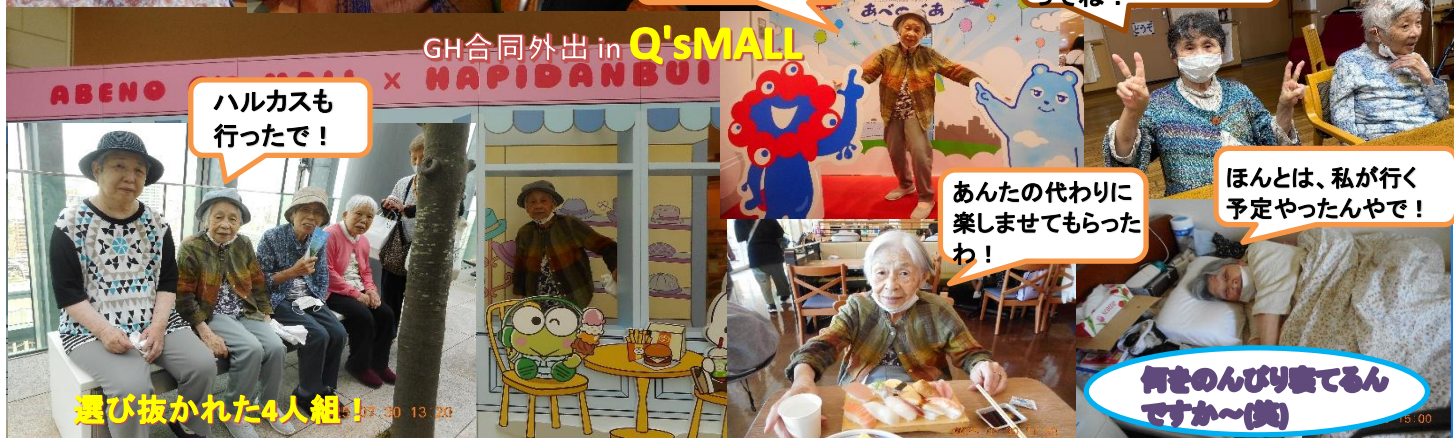
GH合同外出 in Q'sSMALL