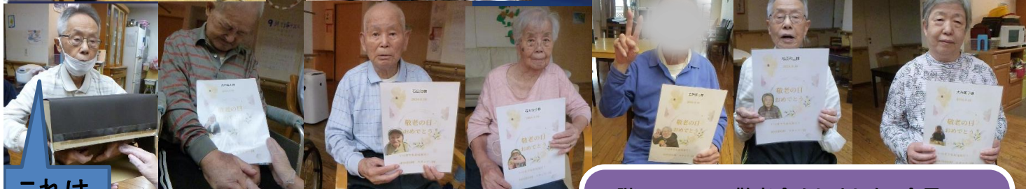
これはなんやろうなあ

4階のフロアで敬老会をしました。全員でゲームをし、最後にはお祝いのカードと一緒に写真を撮り、おいしいケーキをいただきました！！