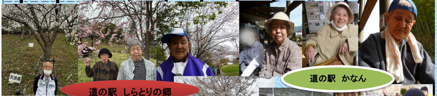
道の駅 しらとりの郷