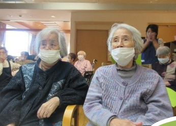
次はどれ歌うのかなあ