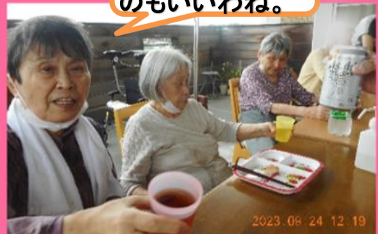
テラスでご飯ってのいいわね。