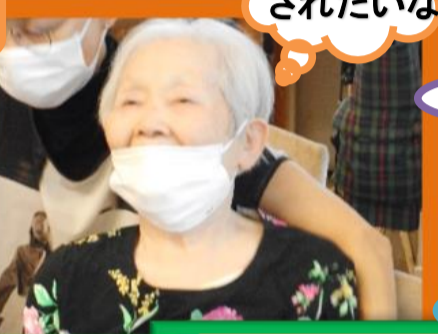
私も表彰されたいな〜。