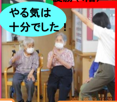
やる気は十分でした!