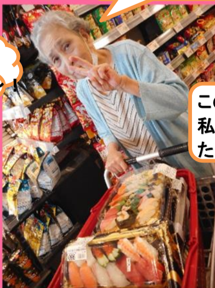
この前は、私が行きましたんやで!