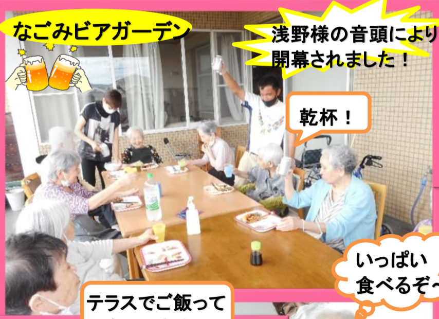
なごみビアガーデン