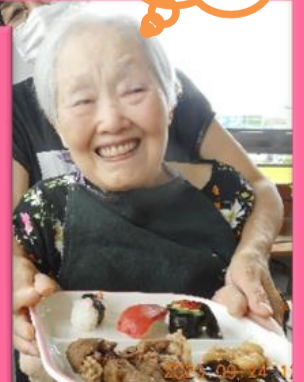
いっぱい食べるぞ〜!