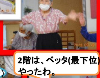
2階は、ベッタ(最下位)やったわ。