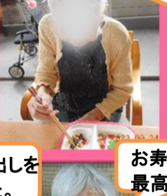
お寿司に梅酒は最高!