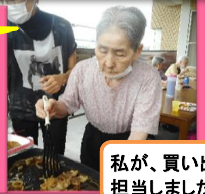
私が、買い出しを担当しました。