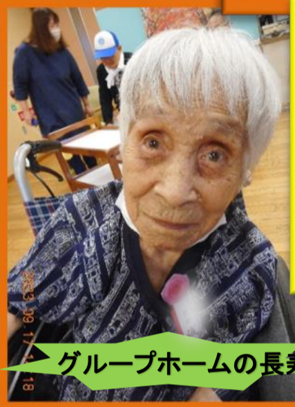
グループホームの長寿