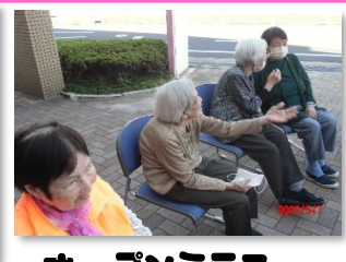
オープンテラス 車いすバスケット