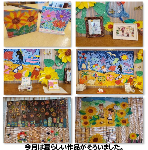
今月は夏らしい作品がそろいました。