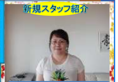
新規スタッフ紹介