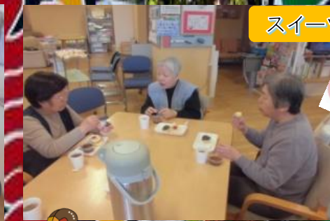
スイーツバイキング