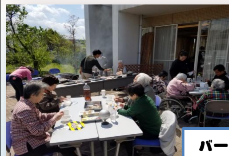
バーベキュー大会