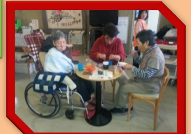
美原オレンジカフェ