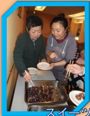
スイーツバイキング

今月の目標 スタッフ同士の雑談ではな く、入居者様との関わりや 見守りを優先する。